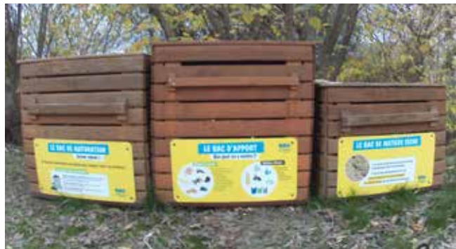
Composteur cave coopérative.